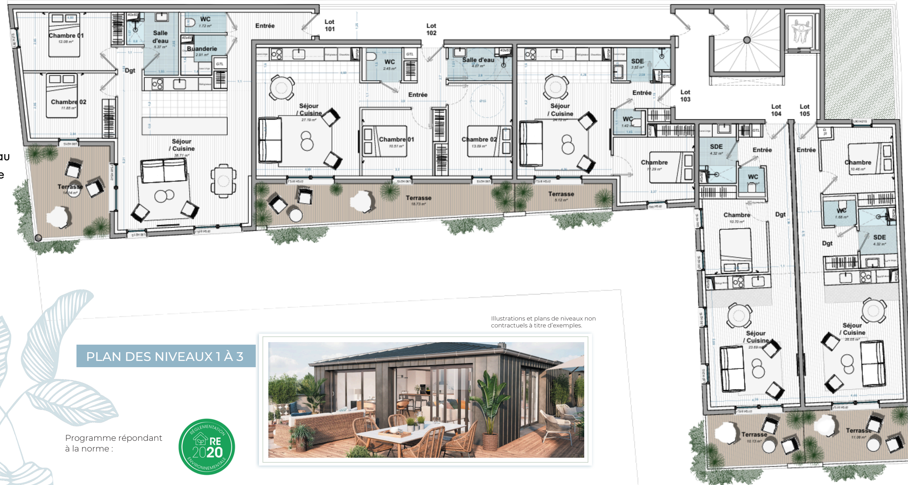
PLAN DES NIVEAUX 1 À 3